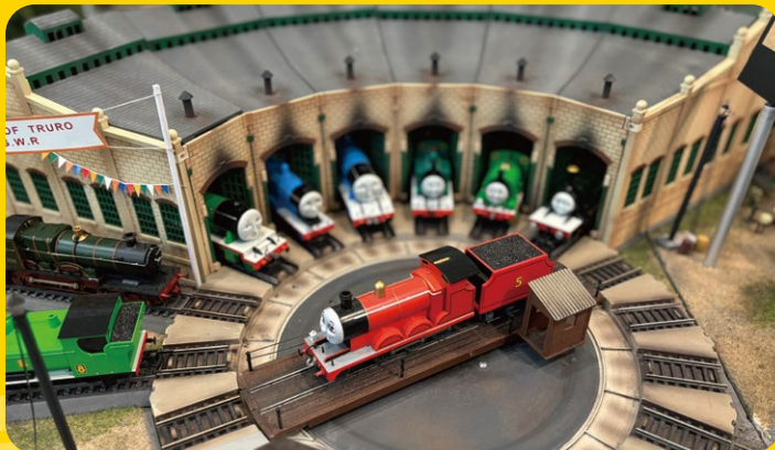
ソドー島ジオラマ(部分)

プロジェクションマッピングを使ったデジタルコンテンツや、トーマスたちが暮らす「ソドー島」の大ジオラマ、展覧会限定のフォトスポットなど体験型の展示が登場します。