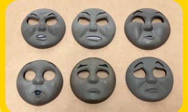
テレビシリーズ撮影のためのトーマスの表情(顔パーツ)