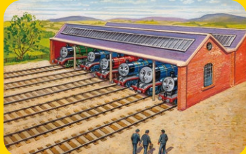
絵本原画(作:レジナルド・ダルビーン) 第1巻「3だいの機関車」より 第1話「エドワードのための1日」

日本ではなかなか見ることのできない絵本原画約40点をストーリーの解説とともに展示します。