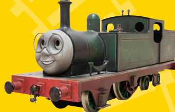
テレビシリーズの撮影で使用された「ウィフ」の模型

モデルアニメーションの撮影に使用された模型や台本、制作過程の映像などを展示・上映します。