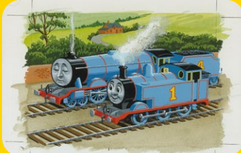
表紙原画(作:クライヴ・スポング) 第27巻「ほんとうにやくにたつ機関車」より