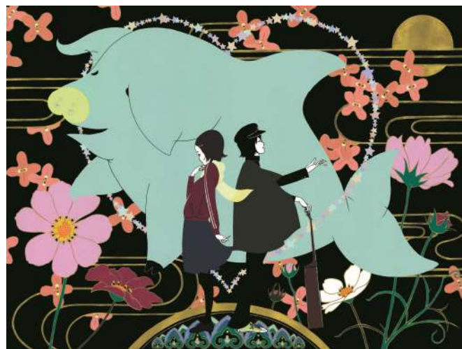
作品名：海豚 / (読み：いるか)