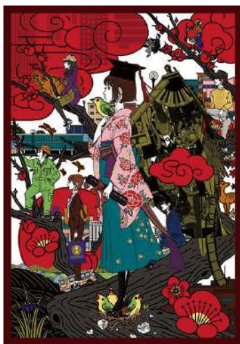
作品名：卒業 / 大阪芸術大学 描き下ろし