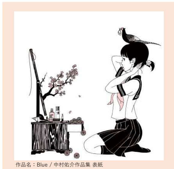
作品名：Blue / 中村佑介作品集 表紙