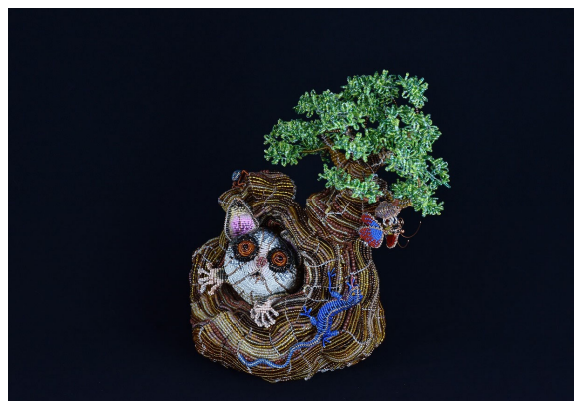
「夜空を見上げるブッシュベイビー」