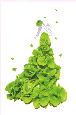
モルセラ / 感謝