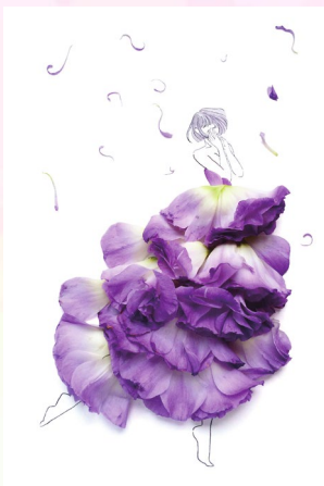
トルコキキョウ (紫) / 希望

花の命を生かし、造形を活かした華麗なドレスのデザインと、心に寄り添うあたたかな花言葉で織りなされる、幸せに満ちた空間をお楽しみください。