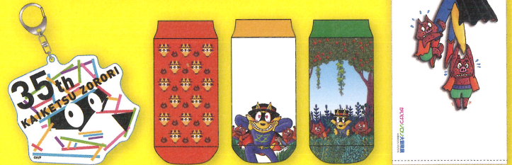
アクリルキーホルダー