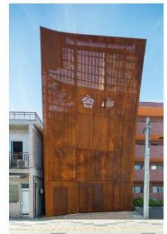
9.香林寺ファサード改修