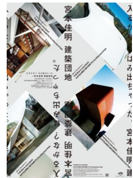
11.チラシデータ ※クレジット表記不要