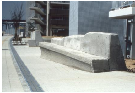
2.南芦屋浜団地コミュニティ&アート計画 "Sacrificatio"