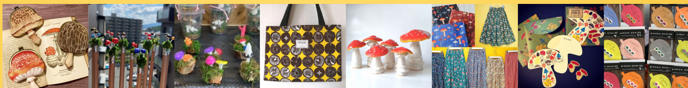
nocco. きのこ大使館 きのこ専門kinoko-Ten mushroom_room ねんどパラダイス ★applegarden★ PURUPURU chiki*moca