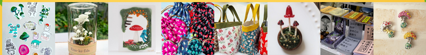
オガサワラミチ Aju 木の粉のキノコ まーにゃおroom ふじべあ oRi-room ちのこ SPORE devigel

※各店舗によって出店日が異なります。詳細は宝塚市立文化芸術センターの ホームページをご確認ください。