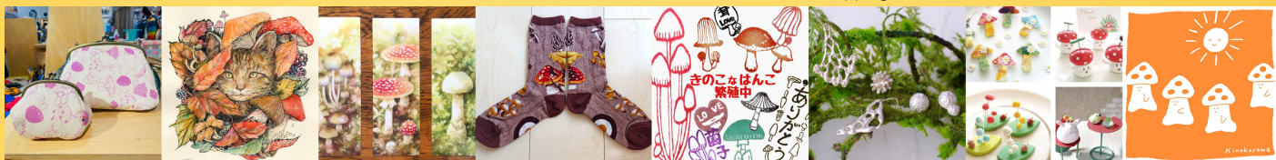
がまぐち屋La Mahina hibi けせらんうさらん 佐野書店 ホリックキノコ sizzle きのこ亭 goo×goo and more ...