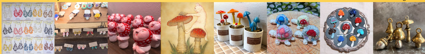
マメホコリ工房 KOHANA ボダイの木 13.CATS.WORKS × YO-CO キキ屋 at CherryY MUU LIFE 工房 marché