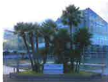
「チャボトウジュロ」

かつてこの地にあった日本植物園協会創立記念樹のチャボトウジュロ。ガーデンフィールズ開園にともない、大阪市の咲くやこの花館に移植されていましたが、センター開園に合わせて黒塗りします。