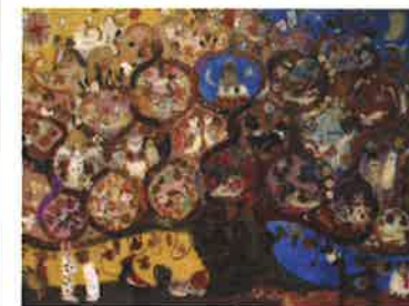
辻司「メキシコの生命の樹シリーズ」